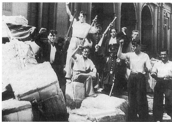
Anoj de la Internacia Brigado

Kreiĝis tri kategorioj de sportistoj: la pintaj atletoj, la spertaj atletoj kaj la amatoroj. Oni volis atingi kiel eble plej multajn homojn sendepende de iliaj fizikaj kondiĉoj. Ankaŭ partopreno de virinoj stimuliĝis.